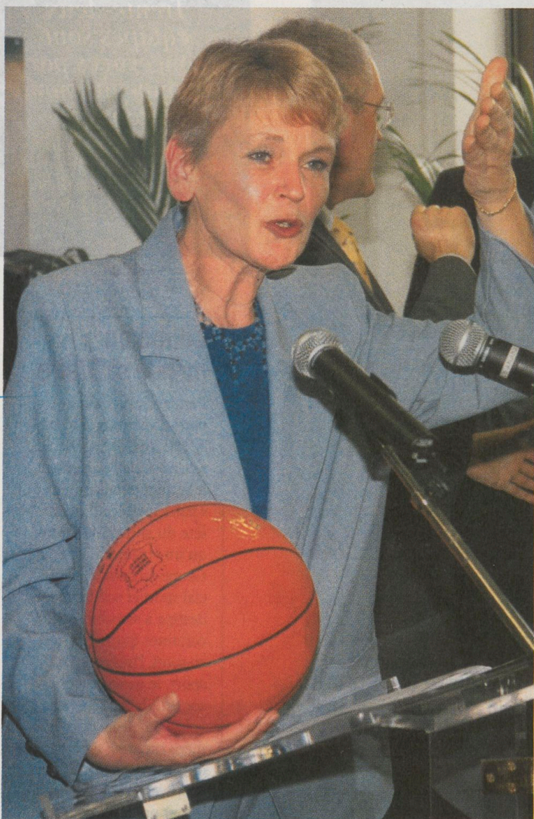
Marie-George Buffet, ministre de la Jeunesse et des Sports.

À quelques jours de la Coupe du monde de football, Convergence a rencontré Marie-George Buffet, ministre de la Jeunesse et des Sports. Une occasion d'aborder le sport et l'insertion ainsi que le projet sur le statut du bénévole.